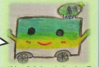
☆ イメージキャラクター しまつち〜君

楽しい旅が出来る範囲でご案内。 新しい旅のエチケット 感染リスクを避けて 安心して楽しい旅行